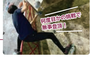
何度目かの挑戦で 無事登頂!