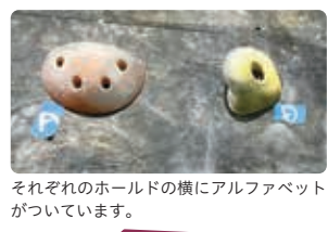
それぞれのホールドの横にアルファベットがっています。