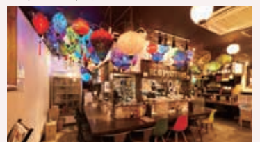
▲映画館通りの中ほどにあるビルの地下。窓越しに見える「盛岡横丁」の大きな提灯が目印。