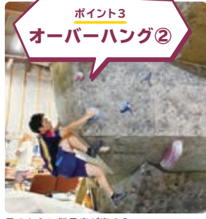
ポイント3 オーバーハング②