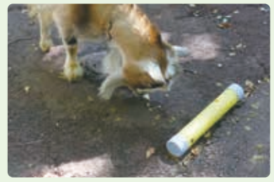
ガス管製のフィーダーを転がして穴から餌を取り出すヤギ。野生での採食行動に近い環境を整えています。

「One World・One Health(人、動物、環境の健康は相互に関連している一つであるという考え方)」を理念に掲げ、2023年春のリニューアルを目指し準備中の「盛岡市動物公園ZOOMO(ズーム)」。そのさまざまな取り組みのひとつに「環境インリッチメント」があります。動物園での飼育環境は、動物が本来生息する環境と比較すると、変化が少ないものになりがち。そのため色んな工夫をして本来の暮らしに近い状態に整えることが、環境インリッチメントです。 盛岡ガスでは、環境インリッチメントの資料としてガス管を提供。ポリエチレン製で強度が高いため、動物が踏んだりかじったりしても割れにくく、怪我や誤飲を防ぐという面でも安全です。また丸洗いが可能で清潔、さらに加工もしやすいため、クマやゾウのおもちゃ、ヤギのフィーダー(給餌器)など、さまざまな用途に活用できます。来春のリニューアルオープン後、黄色いガス管で遊ぶ動物たちの姿が見られるかも?