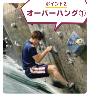
ポイント2 オーバーハング①